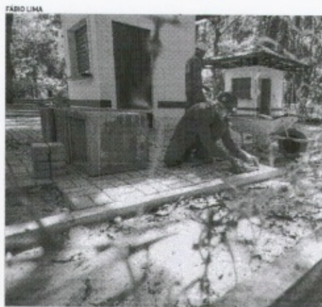
ZOOLOGICO Sargento Prata tem previsão de ser entregue este ano