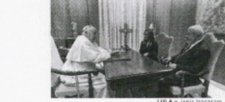
LULA e Janja Trocarão presentes com Francisco

Em seu primeiro dia de agenda oficial em Roma, o presidente Luiz Inácio Lula da Silva (PT) se encontrou ontem com o papa Francisco a portas fechadas no Vaticano. Os dois conversaram sobre a situação política na América Latina, segundo comunicado emitido pela Santa Sé. "Houve uma troca positiva de pontos de vista sobre a situação sociopolítica da região e foram abordadas algumas temáticas de interesse comum, como a promoção da paz e da reconciliação, a luta contra a pobreza e as desigualdades, o respeito às populações indígenas e a proteção do meio ambiente", afirma o comunicado da Santa Sé. O encontro na sala Paulo VI, no Vaticano, durou cerca de 45 minutos. A primeira-dama, Rosângela Silva, a