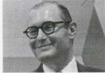
INDICADO para ministro do Supremo Tribunal Federal (STF), advogado Cristiano Zanin.

O Senado aprovou ontem o nome de Cristiano Zanin Martins, de 47 anos, indicado pelo presidente Luiz Inácio Lula da Silva (PT), para vaga no Supremo Tribunal Federal (STF). Constatada sob o argumento de ter critérios constitucionais e republicanos , a escolha de Lula não enfrentou dificuldades para superar a submissão na Comissão de Constituição e Justiça (CCJ) da Casa. Zanin foi beneficiado por uma oposição conformada, quando não aderidas aos governistas, o que evitou um escrutínio mais apertado do do ex-advogado pessoal do presidente. Ele recebeu 58 votos favoráveis e 18 contrários no plenário. O advogado vai ocupar a cadeira deixada pelo ministro aposentado Ricardo Lewandowski. Foi a primeira indicação de Lula ao Supremo no seu terceiro mandato como presidente. Também a mais recente desde quando o petista assumiu o Palácio do Planalto pela primeira vez, há 10 anos.