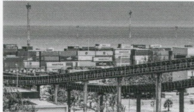
PECÉM é foco dos memorandos assinados