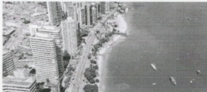
AVENIDA Beira-Mar receberá Parada da Diversidade domingo próximo

BRUNA LIRA ESPECIAL PARA O POVO brunalira@opovo.com.br