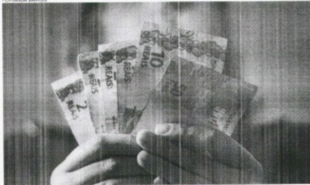
VALOR médio pago às mulheres no Ceará é de R$ 1.809