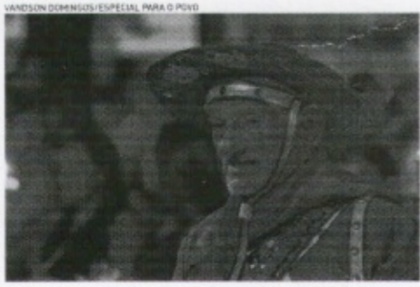
ROMEIRO que participou da procissão

LUCIANO CESÁRIO luciano.cesario@opovo.com.br