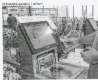
FERNANDA BARRIOS / IPDCO

Essa relação ao comprometimento de renda, o consumidor