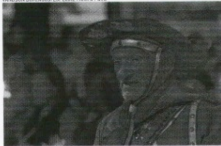
RDMEIRO que participou da procissão

LUCIANO CESÁRIO luciano.cesario@epovo.com.br