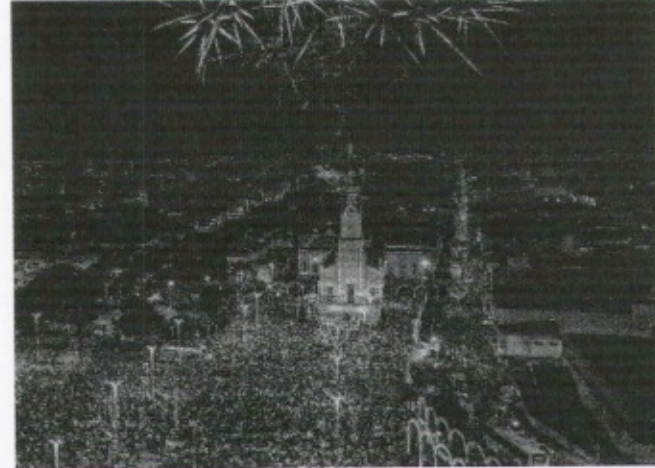
ROMARIA das Candeias voltou a ser presencial após dois anos