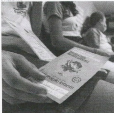
SECRETARIA municipal da Educação acabou recomendando de uso de máscaras nas escolas

Estado do Ceará - Prefeitura Municipal de Capistrano - Ativo Revista Administrativa - Tomada de Preço Nº 04.20.01/2022 - Governo Municipal de Capistrano, Ceará, estabelecida na Praça Manoel José Estoril de Aguiar, s/nº - CEP 62.120-000 - Capistrano, Estado do Ceará, por meio de Edital de Licitação nº 001/2022, para contratação de prestação de serviços de manutenção e conservação predial, para o período de 12 (doze) meses, com início em 15/06/2022, com prazo de entrega de 120 (cento e vinte) dias, a contar da data de assinatura do contrato. O Edital nº 001/2022 encontra-se disponível no site do Portal de Licitação do Estado do Ceará, no endereço eletrônico: www.portal.licitacao.ce.gov.br , a partir das 08h00min em diante, até o dia 13/06/2022, às 17h00min, em caráter de consulta. O Edital nº 001/2022 encontra-se disponível no site do Portal de Licitação do Estado do Ceará, no endereço eletrônico: www.portal.licitacao.ce.gov.br , a partir das 08h00min em diante, até o dia 13/06/2022, às 17h00min, em caráter de consulta. O Edital nº 001/2022 encontra-se disponível no site do Portal de Licitação do Estado do Ceará, no endereço eletrônico: www.portal.licitacao.ce.gov.br , a partir das 08h00min em diante, até o dia 13/06/2022, às 17h00min, em caráter de consulta.