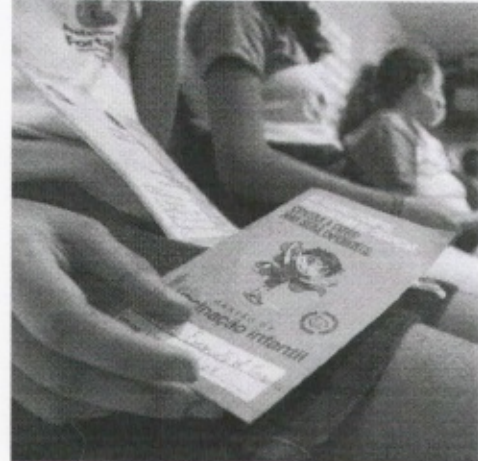
SECRETARIA municipal da Educação acatou recomendação de uso de máscaras nas escolas

Estado do Ceará - Prefeitura Municipal de Capangaba - Aviso Recurso Administrativo Indefinido. - Tomada de Preços Nº 04.25.01022 - Governo Municipal de Capangaba, Ceará, subscritora da Faria Mar - José Gabriel de Aguiar s/nº - CEP: 62.164-000, Ceará - Capangaba, Estado do Ceará, por intermédio da Comissão Permanente de Licitação (CPL), torna pública que as empresas CONDIÇÕES DE TRABALHO E CONTRATAÇÃO DE SERVIÇOS ESPECIALIZADOS EM PREVENÇÃO DE RISCO DE INFECÇÃO - COVID-19 e CONTRATAÇÃO DE SERVIÇOS ESPECIALIZADOS EM PREVENÇÃO DE RISCO DE INFECÇÃO - COVID-19, deverão apresentar proposta técnica e financeira para a aquisição de materiais para prevenção de risco de infecção, de acordo com o Edital de Tomada de Preços nº 02.22.000000 de 2022. Após a abertura de 2022, a Prefeitura Municipal de Capangaba, Ceará.