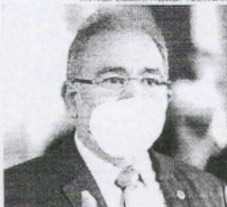
Marcelo Queiroga comanda a pasta da Saúde no governo federal