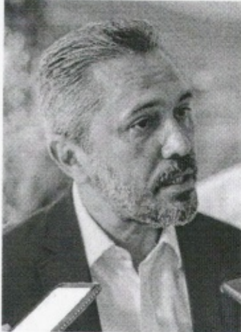
ELMANO de Freitas ao lado de Camilo Santana