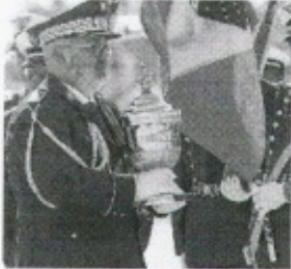
CORAÇÃO de Dom Pedro I chega ao país para as celebrações dos 200 anos da Independência.