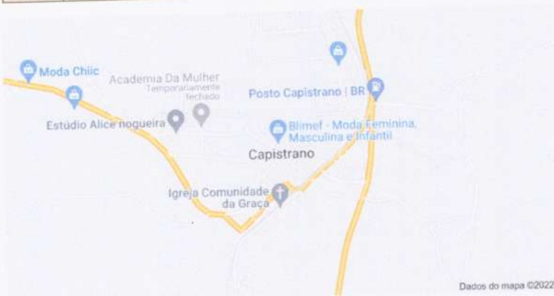
Localização do Município