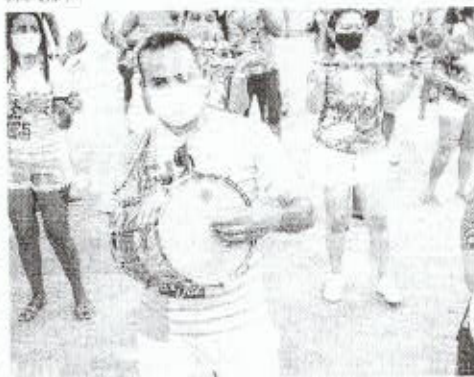
ENSAIO de dança, Lameiros da Vila agremiação cultural tradicional cearense

De acordo com o prefeito, a decisão foi tomada em função da situação atual da cidade, marcada pela pandemia de COVID-19. Sarto afirmou que o Carnaval é uma festa que exige grandes investimentos e que, neste momento, o foco deve ser a saúde pública e a segurança da população.