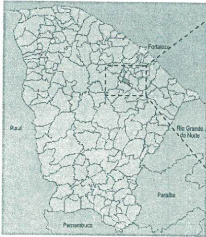
Localização do Município