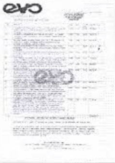
Cotação Capistrano.jpg 1072K