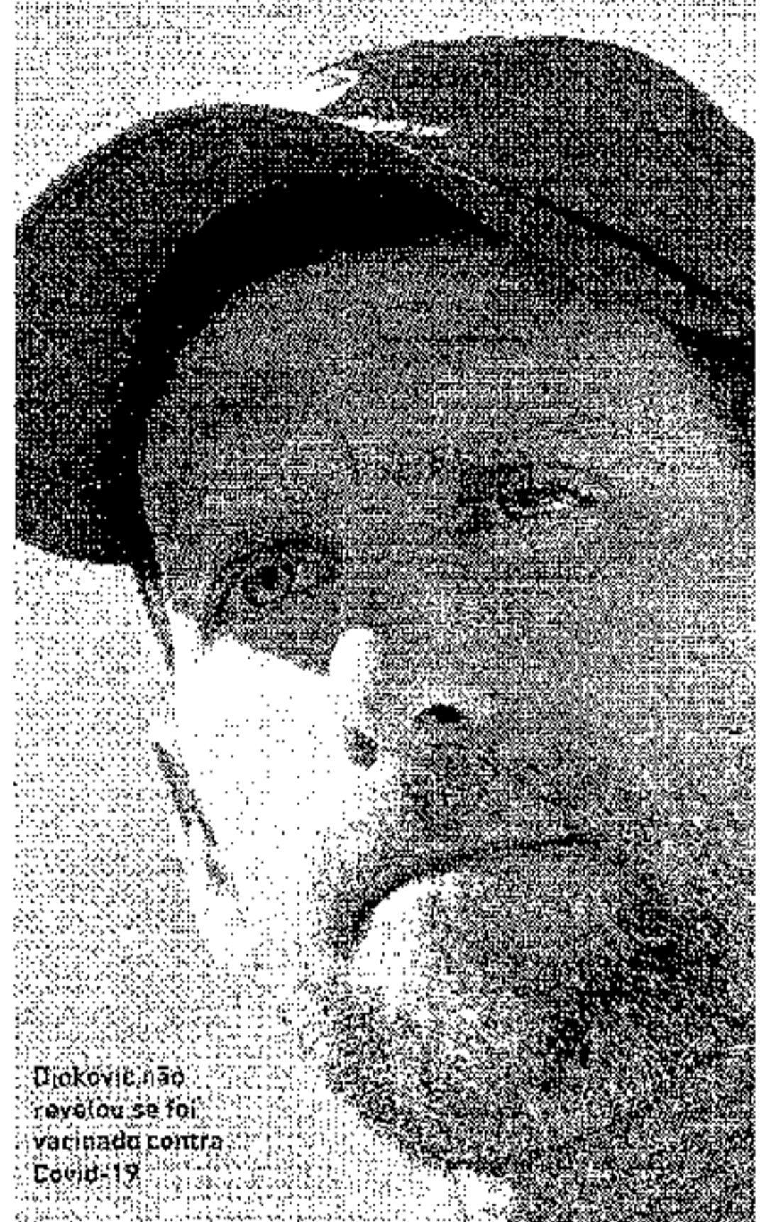
Djokovic não revelou se foi vacinado contra Covid-19

Cidade de São Paulo - Prefeitura Municipal de São Paulo - Processo de Licitação - Pregão Eletrônico nº 2022/0102294 - Objeto: Licitação para contratação de serviços de limpeza e manutenção predial em prédios públicos de propriedade da Prefeitura Municipal de São Paulo. Edital nº 2022/0102294-001. Apresentação de propostas até dia 23/09/2022 às 17h.