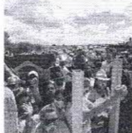
NA PRIMEIRA visita de Bolsonaro como presidente ao Ceará, em 26 de junho, população em Penaforte se aglomera para tentar vê-lo.