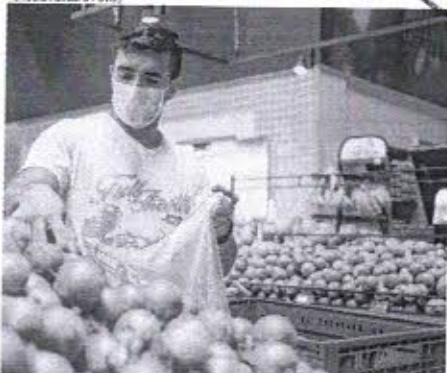
CEBOLA foi item com maior variação de dezembro para janeiro, alta de 33,99% na RMF