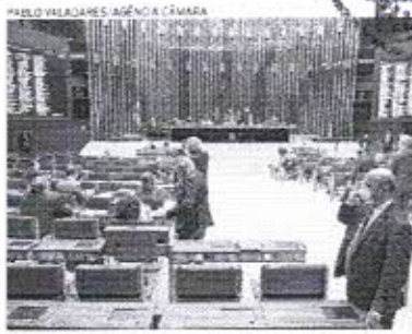
Parlamentar em votação de vetos durante sessão do Congresso