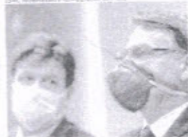
Jair Bolsonaro vem atacando as medidas de prevenção à pandemia de seu ministro da Saúde, Luiz Mandetta