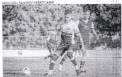
Ferroviário busca segunda vitória em três jogos

Para envolver o adversário, o Tubarão da Barra irá treinar durante toda a semana. Na atividade de ontem, os jogadores que participaram do último duelo flavam trabalho regenerativo, mas o restante da equipe já participou de atividade sob o comando do técnico Marcelo Vilas. Os treinos visam uma partida complicada. O Vila Nova está invicto na Série C, com um empate e uma vitória, vindo de triunfo sobre o Paysandu-PB. A equipe sabe utilizar as linhas de marcação para envolver o