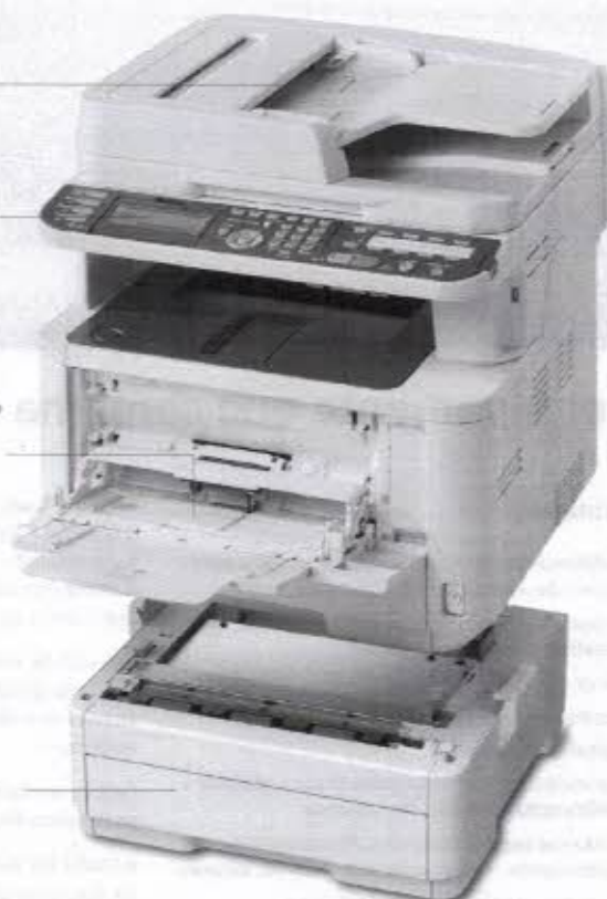
Bandeja Opcional para até 530 Folhas