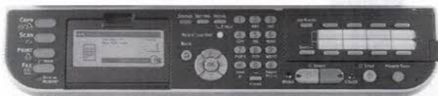
Panel Operador: Tela de 3,5" com teclado alfanumérico.