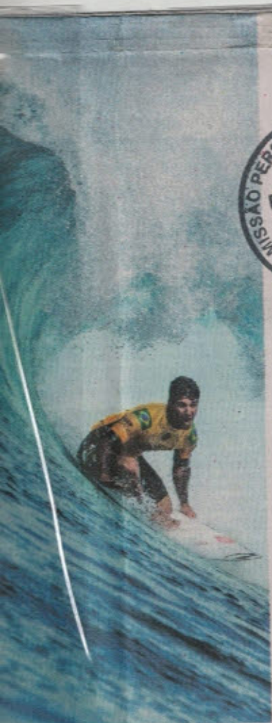
GABRIEL Medina é o atual campeão mundial de surfe