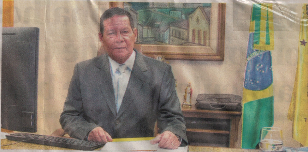
MOURÃO disse que discussão sobre Previdência será feita por Bolsonaro