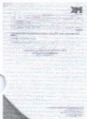
CAPISTRANO 002.jpg 61K