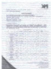
Capistrano 001.jpg 129K