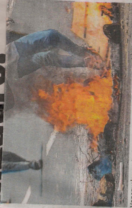
Venezuela: protestos contra Nicolás Maduro se tornam mais violentos

Também exigem eleições gerais, respeito à autonomia do Legislativo e libertação de opositores presos. O TSJ, ao qual a oposição acusa de deixar o Parlamento de mãos atadas por ordem de Maduro, anulou parcialmente as sentenças em meio a uma forte pressão internacional.